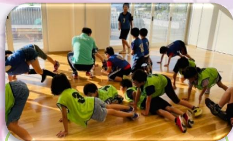
ジグザグトンネルくぐり

状況を瞬時に把握する力、瞬発力、視野の広さ、先を読む力など様々な能力を鍛えられます。普通の鬼ごっこはもちろん、ルールを変えた変化のある鬼ごっこをすることで、つま先から脳まであらゆる部分を使いトレーニングできます。