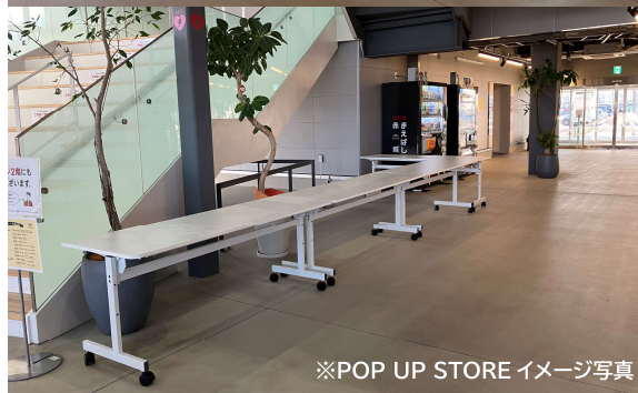
※POP UP STORE イメージ写真