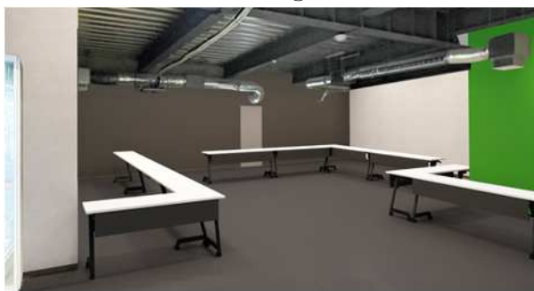
※POP UP STORE イメージ②