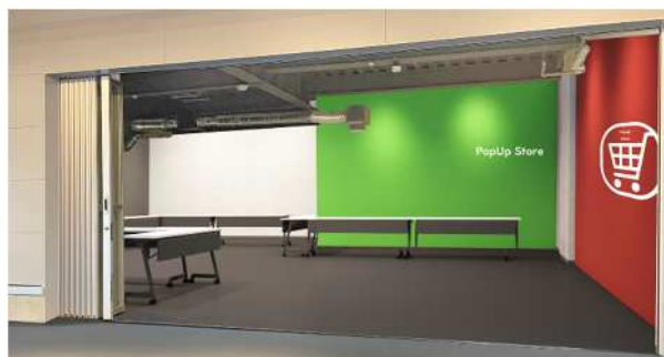
※POP UP STORE イメージ①